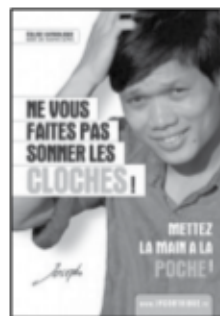
le denier du culte par Di Falco