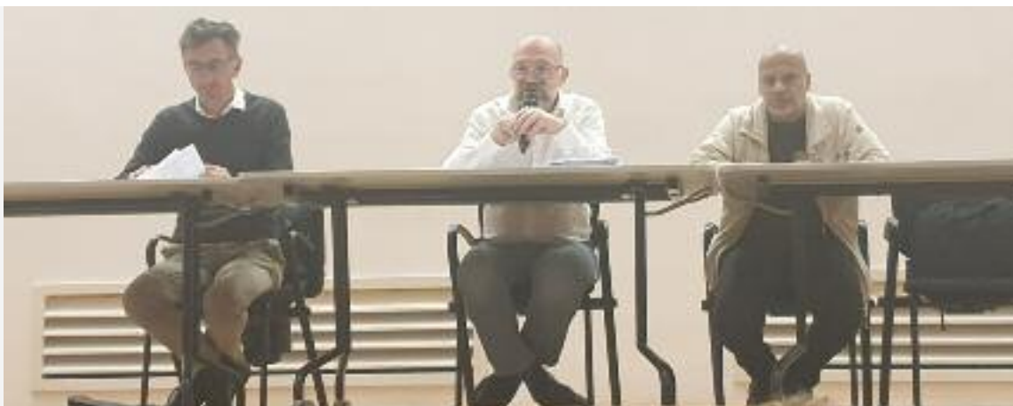
LA TRIBUNE DE L'ASSEMBLÉE COMPOSÉE DU COMMISSAIRE AUX COMPTES, DU PRÉSIDENT ET DU TRÉSORIER