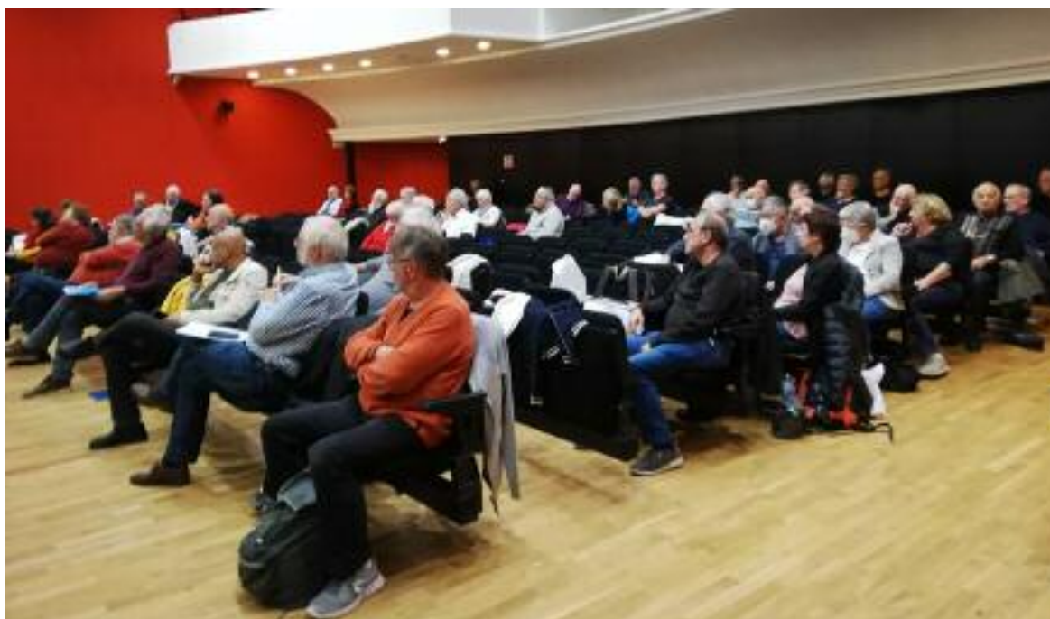
L'ASSEMBLÉE D'ENTRAIDE S'EST TENUE DANS LA SALLE DE SPECTACLE DE LA BOURSE DU TRAVAIL DE PARIS

L'assemblée générale annuelle de ENTRAIDE ET SOLIDARITÉ DES LIBRES PENSEURS DE FRANCE s'est tenue le 1 er octobre 2022, à l'annexe de la Bourse du Travail de Paris 85 rue Charlot, dans le 3 ème arrondissement.