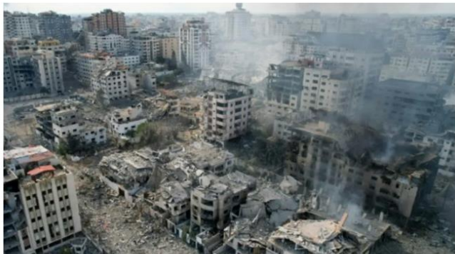
Bâtiments lourdement endommagés à la suite de frappes aériennes israéliennes dans la ville de Gaza, le 10 octobre 2023