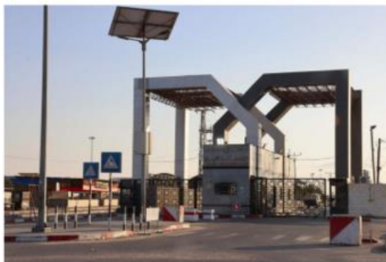
Les portes fermées du poste-frontière de Rafah avec l'Egypte, le 10 octobre 2023.

Ce lundi 16 octobre alors que l'offensive décidée par le Gouvernement Netanyahu allié à l'extrême droite israélienne n'a pas encore débuté sur la bande de Gaza, le blocus total imposé par les autorités israéliennes et les bombardements, y compris des entrepôts alimentaires plongent la population gazaouis dont les conditions d'existence sont déjà insupportables dans un état de détresse absolu. »