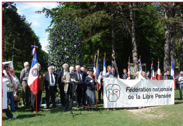
Le rassemblement à Craonne le 17 mai 2008 à l'appel de quatre organisations, la Libre Pensée, l'ARAC (Association républicaine des Anciens Combattants), la Ligue des droits de l'Homme, l'Union pacifiste de France

En une phrase, comme en cent, nous voulons la réhabilitation politique collective des 600 Fusillés pour l'exemple de la Première Guerre mondiale qui sont toujours dans l'opprobre. Tel est notre but, tel est notre chemin. Nous voulons gagner sur tous les cas des fusillés pour gagner une cause