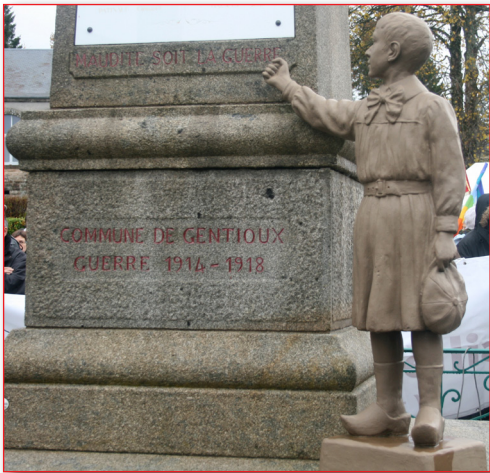
Le monument aux morts pacifiste de Gentioux.