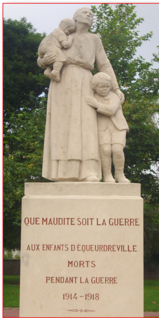
Le monument aux morts pacifiste d'Equeurdreville.

Contrairement à une légende construite après coup, pour des raisons politiques, la vague des assassinats « légaux » de poilus ne date pas des mutineries de 1917, en contre-coup de la Révolution russe. En septembre 1914, le front craque sous la pression des armées allemandes. C'est la panique à Paris, au gouvernement et dans l'Etat-major. Le gouvernement donne plein pouvoir à l'armée pour résister aux « teutons » qui sont à 30 kilomètres de Paris.