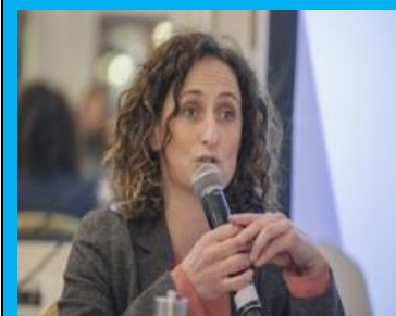
Sénatrice Lynn Boylan à Bruxelles

Sa proposition de loi vise à établir un code de conduite rigoureux, imposant des limites strictes au pouvoir et à l'influence des géants des combustibles fossiles.