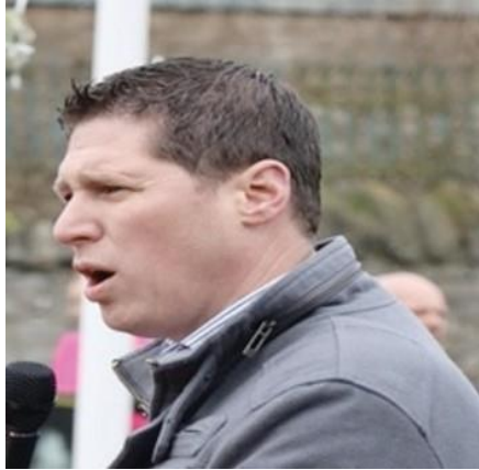
Matt Carthy TD

Pendant ce temps, au sud de la frontière, un changement radical est en cours, car "une nouvelle génération, qui réclame un changement attendu depuis longtemps, se manifeste", a déclaré M. Carthy. Réitérant l'appel à des élections nationales, le député de Cavan & Monaghan a ajouté : "Le gouvernement de coalition Fine Gael-Fianna Fáil est à court d'énergie, d'idées et de temps. Le Sinn Féin veut diriger un gouvernement qui construira des maisons, transformera les services de santé et placera la réunification de l'Irlande au cœur de son programme. "