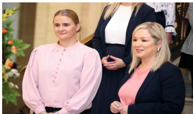
(First Minister Michelle O'Neill and Jr Minister Aisling Reilly)

Alors que la lutte contre le changement climatique s'intensifie, la proposition de loi de la Sénatrice Lynn Boylan est une lueur d'espoir pour ceux qui recherchent une approche plus responsable envers l'industrie des combustibles fossiles