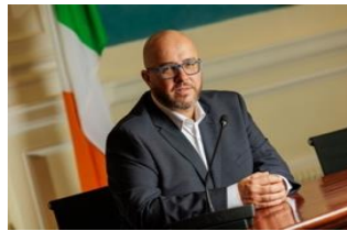
Chris MacManus (Député européen)

Ils défendent des valeurs progressistes - la justice sociale, l'égalité et l'avancée de l'autodétermination en Irlande - et s'ils sont élus, ils travailleront sans relâche pour renforcer ces principes au niveau européen.