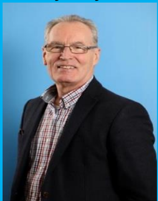
Gerry Kelly MLA