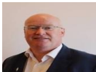
Paul Gavan (Sénateur irlandais Irlandais)