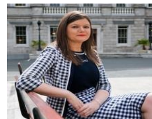
Kathleen Funchion (Députée au Parlement Irlandais)