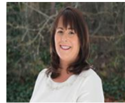
Michelle Gildernew (Députée élue à Westminster)