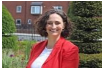
Lynn Boylan (Sénatrice irlandaise)