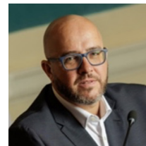
Chris MacManus (Député européen)

En tant qu'équipe, les candidats Sinn Féin au Parlement Européen s'engagent à représenter les intérêts des Irlandais du nord et du sud en Europe. Ils défendent des valeurs progressistes - la justice sociale, l'égalité et l'avancée de l'autodétermination en Irlande - et s'ils sont élus, ils travailleront sans relâche pour renforcer ces principes au niveau européen.