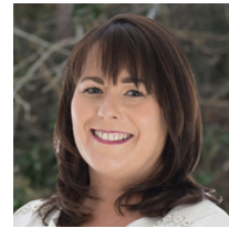
Michelle Gildernew (Députée élue à Westminster)