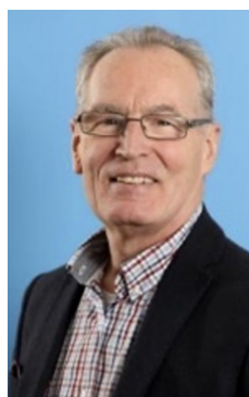
Gerry Kelly MLA

Dans une décision inédite de la Haute Cour de Belfast, la "clause d'immunité" incluse dans la loi « Legacy Act » du gouvernement britannique a été déclarée en contradiction flagrante avec les principes fondamentaux inscrits dans la Convention européenne des droits de l'homme (CEDH).