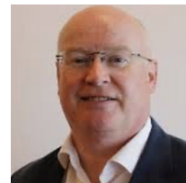
Paul Gavan (Sénateur irlandais)