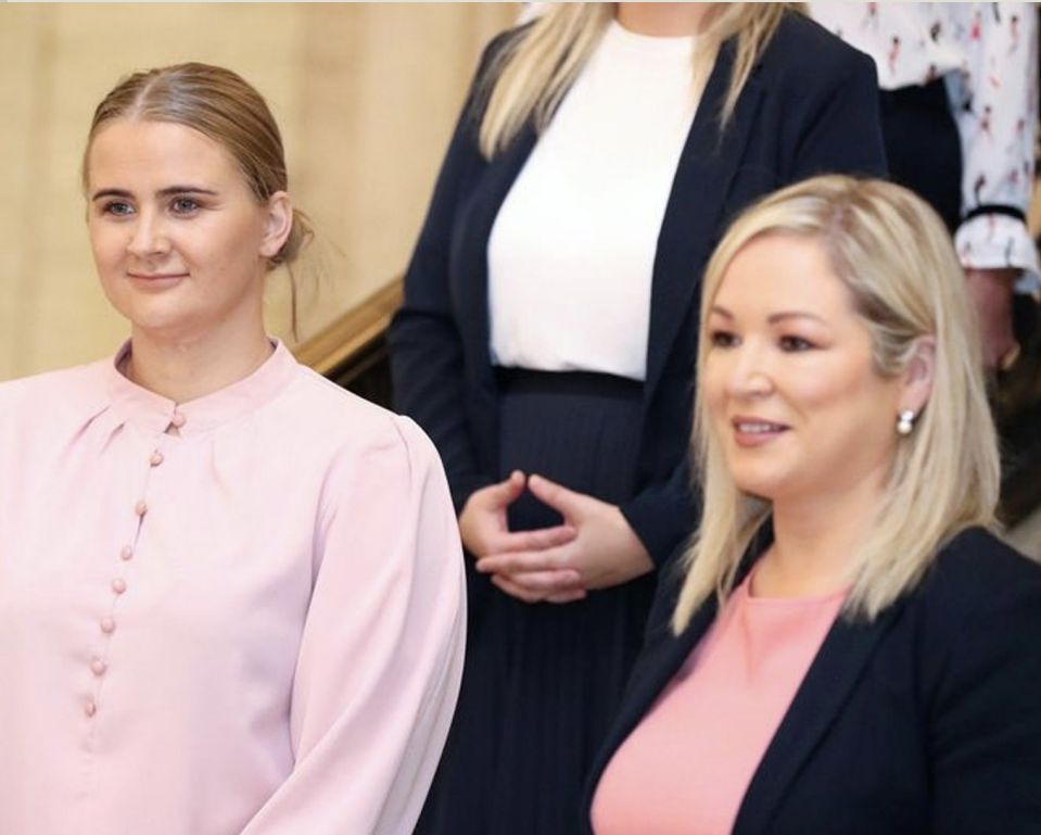
First Minister Michelle O'Neill and Jr Minister Aisling Reilly