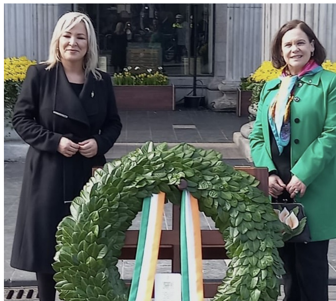
Mary Lou McDonald, présidente du Sinn Féin, et Michelle O'Neill, Première Ministre de Stormont.

Le porte-parole du Sinn Féin pour les affaires étrangères a poursuivi: "Lors des élections européennes, nous avons des candidats de premier ordre qui défendront l'Irlande en Europe, qui défendront la neutralité militaire de l'Irlande, qui chercheront à mettre un