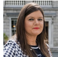
Kathleen Funchion (Députée au Parlement Irlandais)